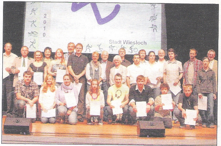
Deutsche Meister und Teilnehmer des Sportabzeichens